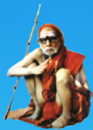
గురు చంద్రశేఖర పరమాచార్య