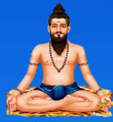
గురు విరభద్రాచార్య స్వామి