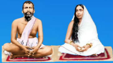
గురు రామకృష్ణ పరమహంస అమ్మి శారదా దేవి