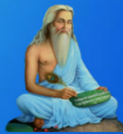
గురు వాల్మీకి మహర్షి