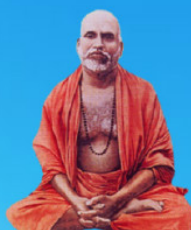
గురు మళయాళ స్వామి