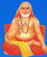
గురు రాఘవేంద్ర స్వామి