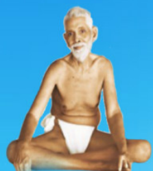
గురు రమాణ మహర్షి