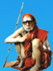
గురు చంద్రశేఖర పరమాచార్య