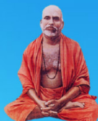
గురు మశయాళ స్వామి