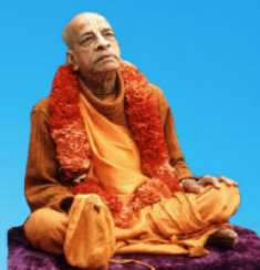
గురు భక్తవేదాంత ప్రభుపాద