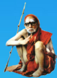
గురు చంద్రశేఖర పరమాచార్య